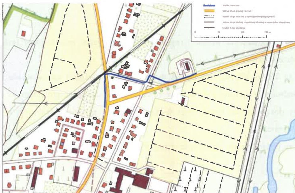
Przebieg proponowanej ścieżki pieszo-rowerowej i rowerowej wzdłuż ul. Szosa Mosińska i ul. Zieleniec (opracowanie: Lehmann+Partner Polska)